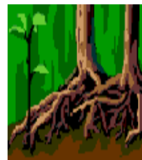
El creyente fundamental, tiene raíz. La presión social no lo arrastra.

El Evangelio no es social. Cada uno dará cuenta de sí. Se debe aprender a tener principios y, para ello, se debe doctrinar, doctrinar y doctrinar y, entre más se doctrine, más raíces se obtienen. Es importante que el cristiano no se deje influenciar por el medio en que vive, sino que permanezca fiel a la Palabra de Dios.