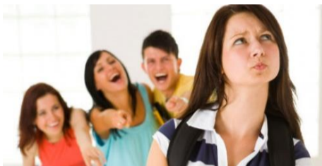
La presión social arrastra.